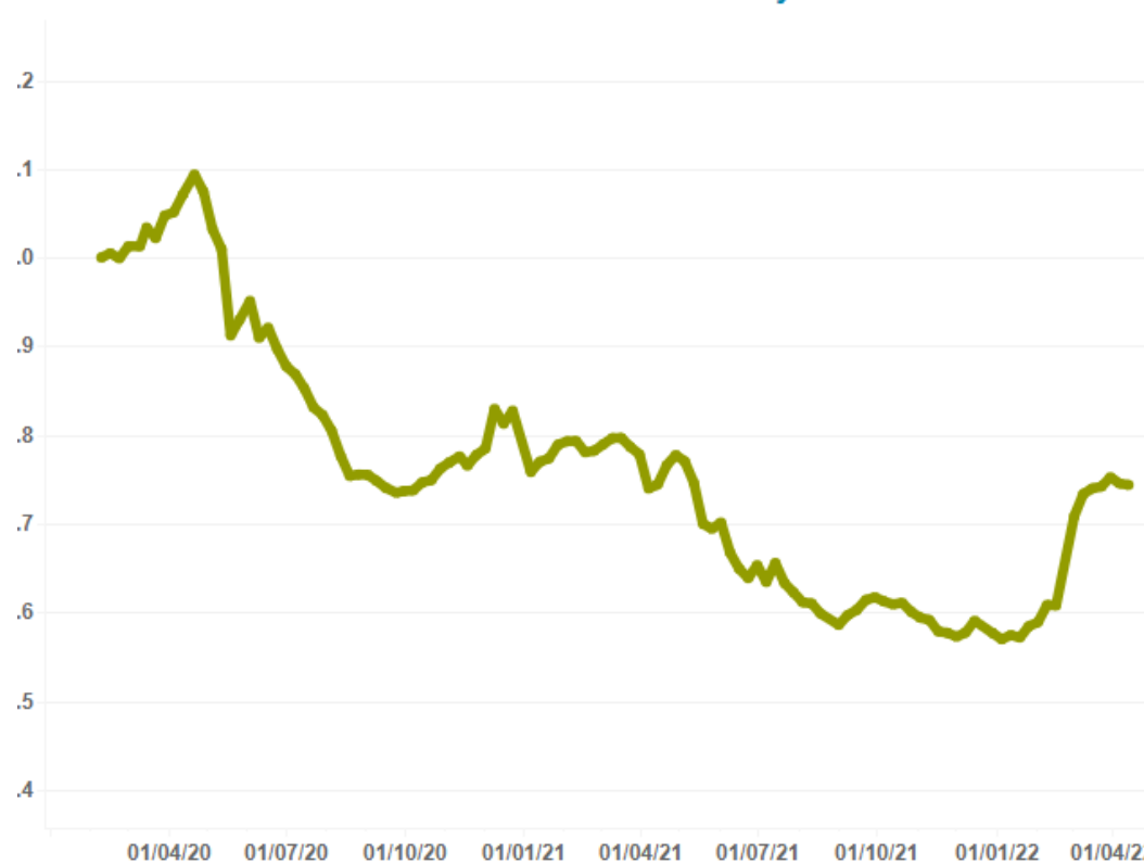
Change in active stock volume Indexed vs. situation on February 9

Dane na wykresie: Średnia ilość aktywnych ogłoszeń.